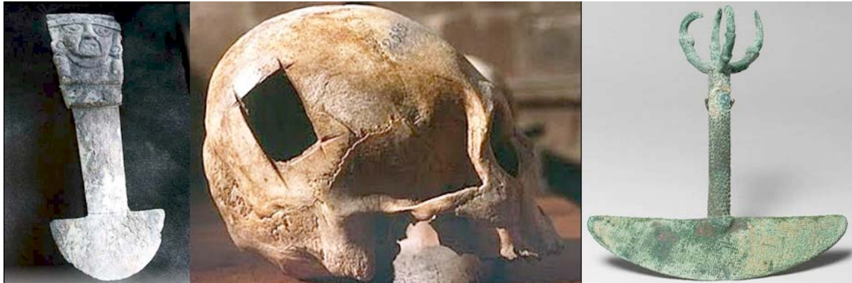
Figura 2. Cuchillos ceremoniales peruanos (tumis) y trepanación craneal parietal en cuadrilátero.

La muestra de Squeir procedía de la región Cuzco del Perú, donde muchos cráneos trepanados se han encontrado desde entonces. Por ejemplo, en una necrópolis de Paracas situada al sur de Lima, fueron encontrados 10.000 esqueletos completos y mejor conservados. Pertenecían a incas, tallanes pre-incas y elementos de la cultura Mochica, y alrededor del 6% de ellos habían sido trepanados, y muchos contenían múltiples agujeros. A partir de estos descubrimientos, fue evidente que la trepanación cuadrada en el cráneo de Squeir no era en absoluto inusual. Ahora se encuentra en el Museo Americano de Historia Natural de Nueva York y fechado entre 1400-1530 (5) .