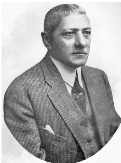
1922. Luis Razetti (1862-1932)

Señor Presidente y demás miembros de la Junta Directiva de la Academia Nacional de Medicina Señores Miembros Correspondientes Nacionales Señores Invitados de Cortesía Señores Miembros Asociados Señoras, señores