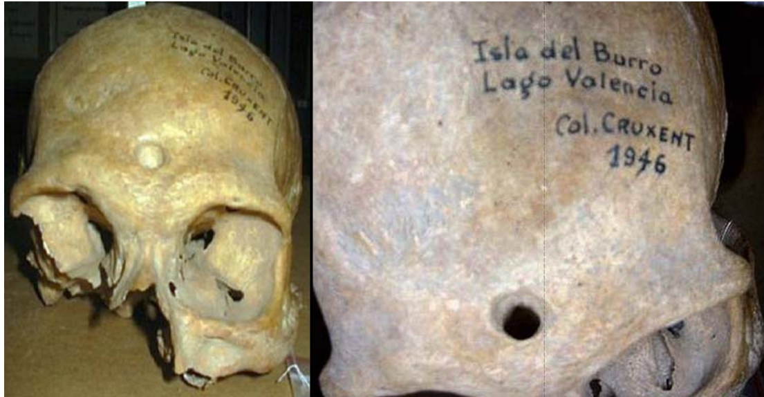
Figura 3. Cráneo de la región caquetía del Lago de Valencia (Venezuela) hallado por el arqueólogo J.M. Cruxent en 1946.

A finales del siglo XIX y principios del XX, aparecieron diversas publicaciones sobre traumatismos craneoencefálicos y trepanaciones craneales en la Gaceta Médica de Caracas, órgano de la Academia Nacional de Medicina y en el Boletín del Hospital de la Caridad de Barquisimeto. En Venezuela, los pioneros de intervenciones craneanas son como sigue: